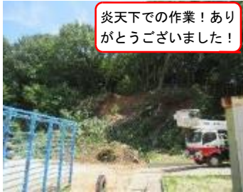
炎天下での作業！ありがとうございます！

～7月1日(土) 未明にかけての大雨で被災した「夢の山」。工事業者の方が連日の猛暑の中も工事を続けてくださったおかげで、立ち入り禁止区域を土砂崩れ周辺のみとして9月1日を迎えることができました。4日からは、グラウンドでのボール遊びも再開。常に安全を確認しながら、教育活動を進めていきたいと思っておりますのでご理解の程よろしくお願いいたします。