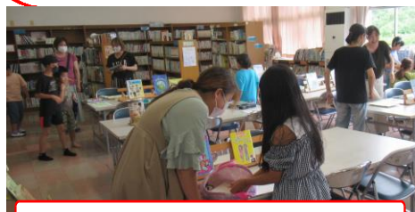
日や時間帯によっては、こんなに利用者が！

今年の夏休みは「図書室開放」を計8回実施。昨年度が4回ですから2倍の開室です。実に、のべ100名以上の利用がありました。毎回地域の方が、ボランティア司書をしてくださったおかげで、子どもたちは本を読んだり、調べ物をしたりと有意義な時間を過ごすことができました。ありがとうございました。