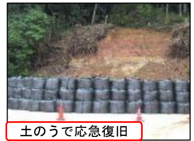
土のうで応急復旧

～7月1日(土) 未明にかけての大雨で被災した「夢の山」。工事業者の方が連日の猛暑の中も工事を続けてくださったおかげで、立ち入り禁止区域を土砂崩れ周辺のみとして9月1日を迎えることができました。4日からは、グラウンドでのボール遊びも再開。常に安全を確認しながら、教育活動を進めていきたいと思っておりますのでご理解の程よろしくお願いいたします。