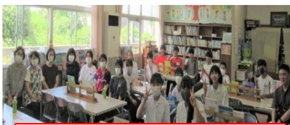
世代を超えてサポーター集結。まさに「チーム島田小」です。

<子どもたちの感想（ほんの一例）> ★高校生、中学生、地域の方と学習して、経験や知識などいろいろなことが学べるようになった。★この三日間優しく教えてくれてスキルアップ教室に来てよかった。これからももっと勉強していきたい。★高校生が「丸つけは大事」だと教えてくれたので、○つけはしっかりしないとと思った。★地域の人たちとの仲が深まったと思う。★わかりやすく教えてくれて今ではすらすら解けてとてもうれしかった。★地域の人や中学生の人が「次もがんばってね。すごいね。」と言ってくれてとてもうれしかった。★夏休みでも友達と勉強ができてとてもうれしかった。★中学生や高校生になったら絶対教えに来たいです。