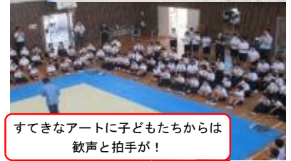
すてきなアートに子どもたちからは歓声と拍手が！