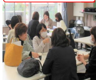
PTA総会後のサロンの様子 お茶を飲みながらホットー息！

また、新たに役員をご承引くださった皆様、これから1年間よろしくお願ひいたします。