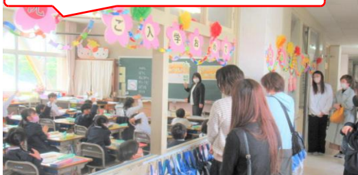
入学して1週間。1年生はとっても元気！

4月19日(水)に今年度第1回参観日を開催。特に1年生は入学後初の参観日。朝からはりきっていました。もちろんどの学年・学級も進級したてで意欲満々でした。4年ぶりに「ご家族2名まで」といたしましたので多くの方のご参観に私たち教職員も感無量です。授業後の学級懇談会にもたくさんの方にご出席いただけ、お子様をお預かりしている責任感も倍