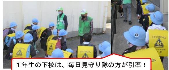
1年生の下校は、毎日見守り隊の方が引率！

毎朝、子どもたちはたくさんの方に見守られて安全に登下校できています。また班長・副班長の子どもたちも、1年生に気を配りながら登校してくれています。安全面だけでなく「あいさつ運動」でもご協力いただく中で子どもたちは毎朝元気いっぱいに登校できていると感じています。島田の温かい風土に包