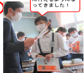
学び合いも、活発に行えるようになってきました！

4月19日(水)に今年度第1回参観日を開催。特に1年生は入学後初の参観日。朝からはりきっていました。もちろんどの学年・学級も進級したてで意欲満々でした。4年ぶりに「ご家族2名まで」といたしましたので多くの方のご参観に私たち教職員も感無量です。授業後の学級懇談会にもたくさんの方にご出席いただけ、お子様をお預かりしている責任感も倍