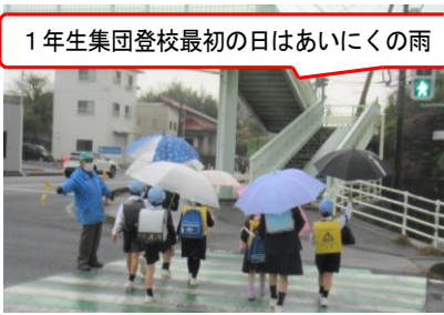
1年生集団登校最初の日はあいにくの雨