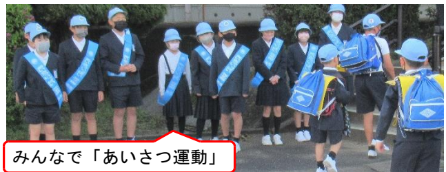
みんなで「あいさつ運動」