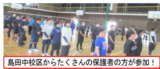
島田中学校区からたくさんの保護者の方が参加！

6月24日(土)、島田中を会場に「第48回島田中学校区5校親睦球技大会」が開催されました。島田小は、3年ぶりに開催された昨年度の大会で何と準優勝。今年度は優勝をめざし金曜日の夜を中心に練習を重ねてきま