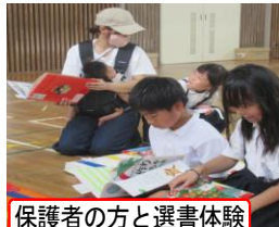
保護者の方と選書体験

また、13日(木)には選書会を実施。体育館に所狭しと並べられた新書にわくわく。学校の図書室に入れてほしい本を一人ひとりが選びました。短い時間ではありましたが、「この本おもしろそう」とみんなで顔を突き合わせながら本を選ぶ姿はなんともほほえましかったですよ。人気のあった本を今後購入し図書室に配本。楽しみです。