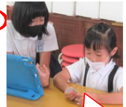
たし算タイム：たし算カードのクリア時間を計..誤答も優しく教えてあげています。

(地域の方は、本を借りることはできませんが、図書室の本を自由にお読みいただけます。)