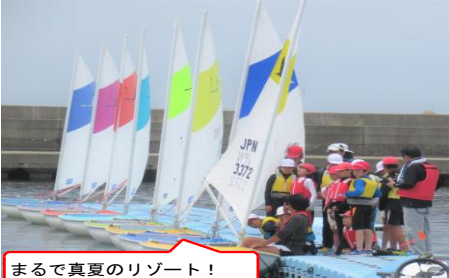
まるで真夏のリゾート！

左の内容の他、食事や入浴、すべてが学習！コロナ禍で、様々な体験活動がストップや縮小を余儀なくされてきた中子どもだけでの宿泊は、ほぼ初体験と言ってもよいかも知れません。まさしくチャレンジづくしの2日間でした！