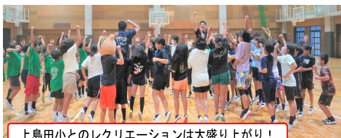
上島田小とのレクリエーションは大盛り上がり！

7月6日（木）・7日（金）、光市のスポーツ交流村にて5年生が宿泊学習を行いました。2日目の朝に雨が降って心配されましたが、メイン活動となる「マリンスポーツ」は晴れ間も出る奇跡的な天候に！最高の体験となりました。上島田小との交流（レクリエーション）も大いに楽しみ、思い出満載の2日間と。内容は右ページの通りです。