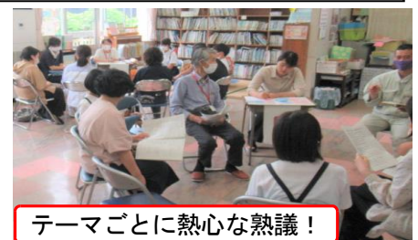
テーマごとに熱心な熟議！