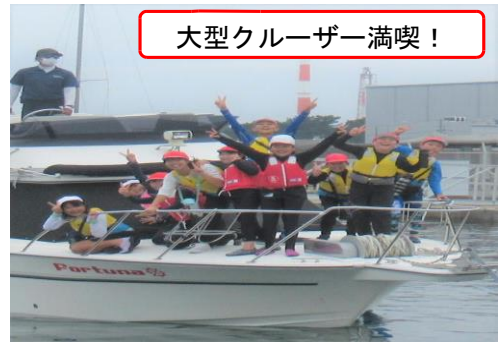
大型クルーザー満喫！

2日間、寝食をともにしたことで得られる自他の良さの発見と、より強く太く結ばれる絆。コロナ禍で遠ざかっていた水に親しむ体験で感じた「海のすばらしさ」と「海の怖さ」。そして離れてわかる家族への感謝は、光の海の景色とともに子どもたちの心に刻まれ、さらなる成長の糧となると確信した宿泊学習です。