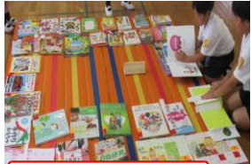
たくさんの本を展示

また、13日(木)には選書会を実施。体育館に所狭しと並べられた新書にわくわく。学校の図書室に入れてほしい本を一人ひとりが選びました。短い時間ではありましたが、「この本おもしろそう」とみんなで顔を突き合わせながら本を選ぶ姿はなんともほほえましかったですよ。人気のあった本を今後購入し図書室に配本。楽しみです。