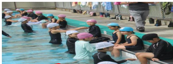
6年生がやさしくエスコート！