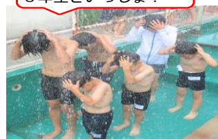
地獄のシャワーも 6年生といっしょ！

今年は、異学年と一緒に水泳を行うなど多彩に授業を企画。1年生は大きなプールで泳ぐのは初めての子も少なくありませんでしたが、6年生のサポートで全員がプールを楽しむことができました。はじける水しぶきにはじける笑顔。学校は、学びのテーマパークですね。