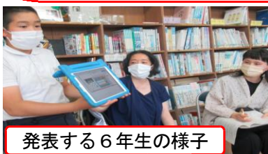
発表する6年生の様子

上記掲載の通り、6月14日(水)に、本校初となる、児童・保護者・教職員・地域の方参加型で右の3つのテーマで熟議(じっくり話し合う協議)を実施しました。