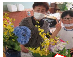
地域の方に教えていただいて嬉しそう！

昨年度から毎月実施している「花いっぱいの日」は季節を感じる日でもあります。6月は、子どもたちや地域の方が赤紫や青紫のアジサイをたくさん持ち寄ってくれました。今回は希望の子ども生け花体験。花はいつでも大歓迎ですので、お分けいただけるお花がございましたらぜひ学校におもちよりいただくと幸いです。