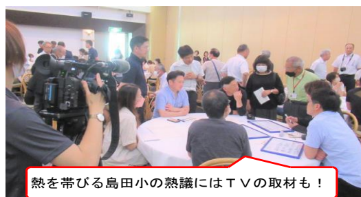
熱を帯びる島田小の熱議にはTVの取材も！

親睦ソフトバレーボール大会と同日の夕方に、島田中学校区の保護者が集まって、「子育て」について意見交換する場を初めてもちました。小学校からの「反抗期」「進路」などの質問に、「一緒に悩むことが大事」と中学校の保護者の方が回答する場面も。会場も大納得。あっという間の90分でしたが、サミット後にも校内外の保護者同士のつながりを作っておられ、ソフトバレーボール同様、この会のメリットの大きさも感じたところです。（このサミットも、地域協育ネットの主催です。）