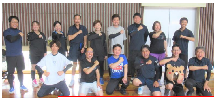
チーム島田小！このチームワークが子どもの未来を拓きます

さんから「すばらしいチームワーク」と太鼓判を押していただきました。小中のPTAが笑顔で親睦を深め、健闘をたたえ合った一日。参加いただいた島田小の保護者の皆様、そして主催いただいた島田川協育ネット・島田中学校に大いに感謝です。