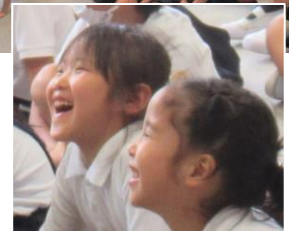
読み聞かせを心から楽しんでます