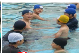
6年生と一緒にだからだいじょうぶ！