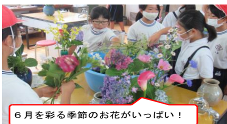
6月を彩る季節のお花がいっぱい！

昨年度から毎月実施している「花いっぱいの日」は季節を感じる日でもあります。6月は、子どもたちや地域の方が赤紫や青紫のアジサイをたくさん持ち寄ってくれました。今回は希望の子ども生け花体験。花はいつでも大歓迎ですので、お分けいただけるお花がございましたらぜひ学校におもちよりいただくと幸いです。