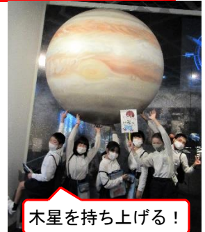
木星を持ち上げる！

＜グリーンランド＞特別入場ゲートから開園前に入場。多い子で20以上のアトラクションを制覇し、自由昼食・大切な家族への買い物も含めて4時間を大満喫。汗ばむほどの好天で、みんなの笑顔が輝いていました。