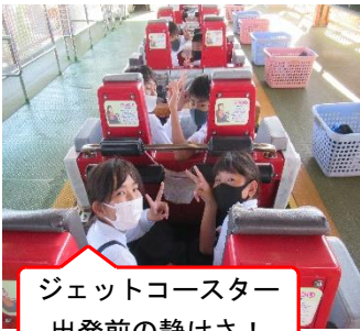
ジェットコースター 出発前の静けさ！

3年生の学年末からコロナ禍にあった6年生は、小学校での多くの行事が中止や縮小となってきました。6年生にとって初めての宿泊、初めての県外となる今回の修学旅行には、児童全員参加のもと、最光の天気にも恵まれた中での実施となりました。3年間の思いを凝縮したような2日間。最高の仲間と最幸な時間を過ごした子どもたち。きっと、将来、旅行中のエピソードで盛り上がることでしょう。