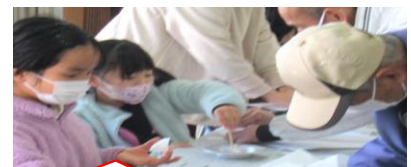
地域の方がやさしく教えてくださるので高く飛びそうです！