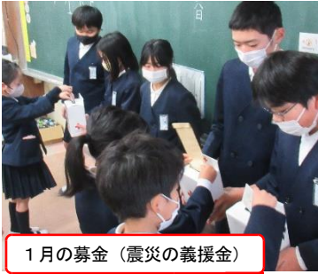
1月の募金（震災の義援金）