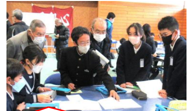
中学生と活発に協議する児童

1月26日(火)、島田中校区の4つの小学校5・6年生有志と島田中新生徒会が島田中学校に集まり、「島田川っ子サミット」を開催。本校からも5・6年生計11名が参加しました。このサミットは、島田中生徒会が主催し毎年2回開催されるもの。驚くのは、新生徒会長をリーダーとして、生徒が全て