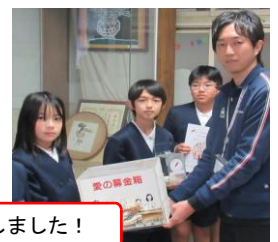
社会福祉協議会の方にお渡ししました！

お困りの方にお声掛けをするための研修なども行っています。募金活動も大切にしている取組で、地域福祉に役立てていただく目的で、10月の街頭募金に続き12月には校内での募金活動を行いました。さらに、こうした経験から、この度の能登半島地震によって「被災された方々のために何かできないだろうか」との思いが子どもたちからも沸き起こり、支援・救護活動をしておられる日本赤十字に協力する形でこの1月に募金活動を行ったところです。島田小学校児童は、全員が「青少年赤十字（ジュニア・レッド・クロス）」に加盟しており、「気づき・考え・実行する」を合言葉にしています。今回、子どもたちが気づき・考え・実行した募金を役立てていただくと