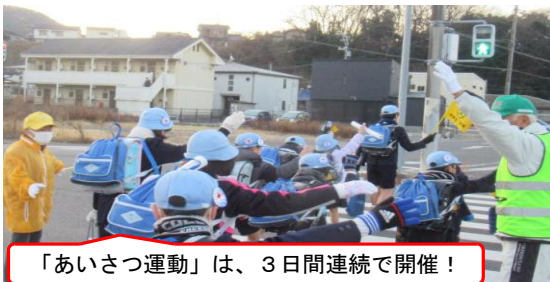
「あいさつ運動」は、3日間連続で開催！

初登校から3日間は、朝がぐっと冷え込みました。しかしながら、地域や保護者の方、運営委員会児童のあいさつ運動のおかげで心は温か〜くなったようです。9日(火)の日には、「おはようございます！」に「今年もよろしくお願いします。」などを付け加えた子も…。久しぶりの登校でしたが、かわす皆さん、ありがとうございました。