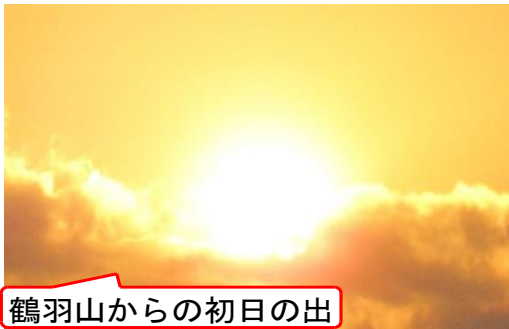
鶴羽山からの初日の出

年頭にあたり、まずもって元日に起きた大地震により亡くなられた方のご冥福をお祈りするとともに、被災された方々に心からお見舞い申し上げます。未だに余震が続く中、眠れない夜を重ねている子や、家が焼失するなどして自宅に戻れない子どもたち、再開のめどが立たない学校の状況等の報道に心が痛みます。一日も早い復旧と復興を望むばかりです。