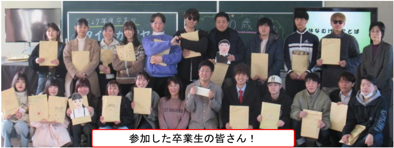
参加した卒業生の皆さん！