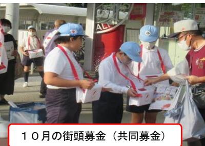
10月の街頭募金（共同募金）

12月には、光市社会福祉協議会が行う「赤い羽根共同募金」に協力。本校5・6年生の福祉委員会児童が全校児童を対象に募金活動を行いました。島田小は、伝統的に「福祉教育」に力を入れており、島田地域の敬老会への参画やお一人暮らしのご高齢の方にお手紙をお送りする活動の他、