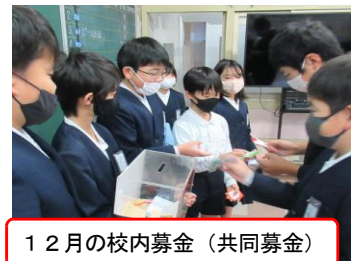
12月の校内募金（共同募金）

12月には、光市社会福祉協議会が行う「赤い羽根共同募金」に協力。本校5・6年生の福祉委員会児童が全校児童を対象に募金活動を行いました。島田小は、伝統的に「福祉教育」に力を入れており、島田地域の敬老会への参画やお一人暮らしのご高齢の方にお手紙をお送りする活動の他、