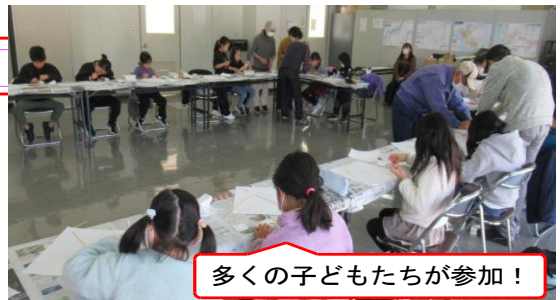
多くの子どもたちが参加！

「たこづくり」名人の地域の方に教えていただきながら「世界に一つ」の「オリジナルたこ」づくりに夢中になっていました。今月20日（土）がたこあげ大会。参加予定の子どもたちは楽しみにしているようです。（晴れるといいな！）ところで凧あげは昔ながらの遊びですが、今の子どもたちも大好きです。島田小では1年生全員が学校でも凧づくり。16日（火）には、できたてほやほやの凧でさっそく凧あげ。グラウンド高く上げようと楽しそうにグラウンドを走り回っていました。そしてみんな笑顔なのです。来年は、凧づくりの参加者がさらに増える予感がします。